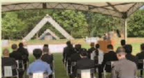
8月6日 平和祈念式典 (星野村ふるさと公園)