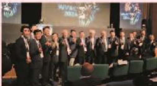
4月16日 WVC世界獣医師大会2024 (南アフリカ ケープタウン)