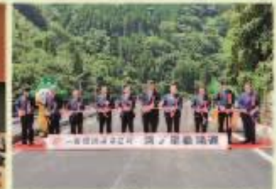
8月3日 矢部村宮ノ尾橋開通式典