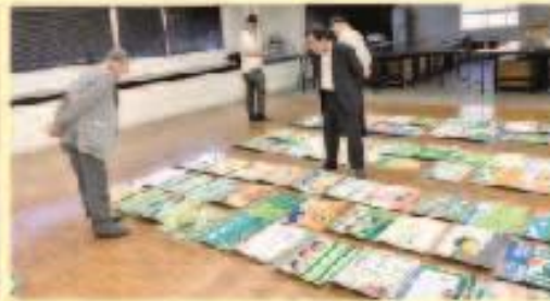
10月11日 お茶の絵画コンクール審査