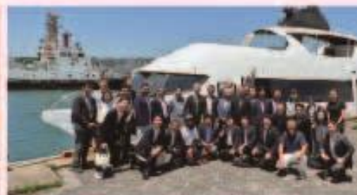
5月19日 水素・バイオ燃料ハイブリッド船視察 (門司港にて)