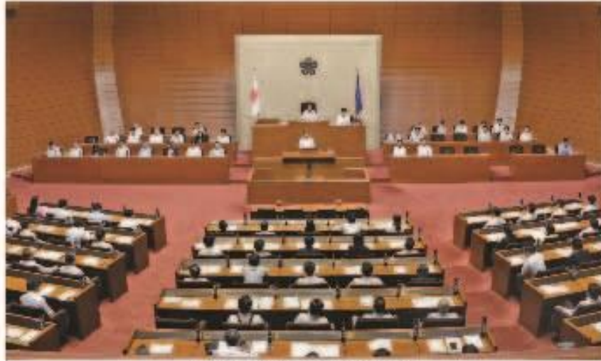
決算特別委員会 委員長報告