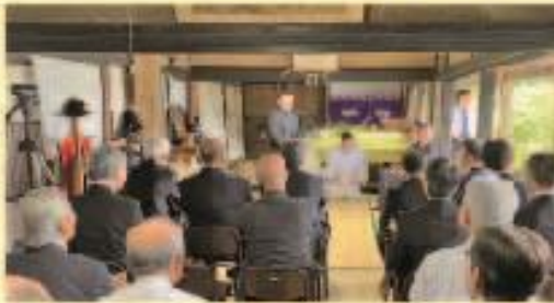
9月22日 御旗まつり (五條邸)