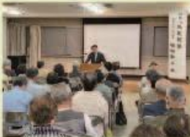
6月27日 たちばな熟年会県政報告