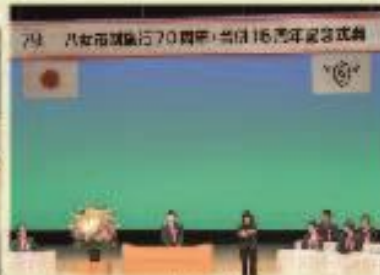
6月30日 八女市制施行70周年・合併15周年記念式典