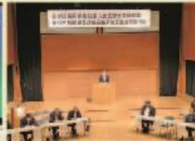
7月13日 福岡県農政連八女支部 総代会