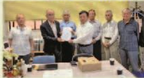
6月5日 立花町松尾地区県道改良要望