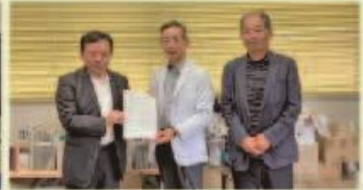
6月22日 黒木町荳原地区県道改良要望