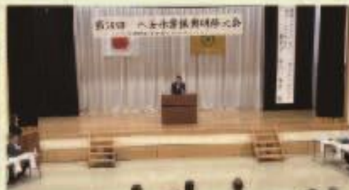
8月22日 八女林業振興研修大会