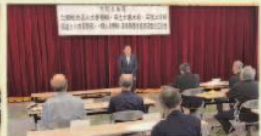
8月22日 上郷町管内5路線整備促進期成会 設立総会