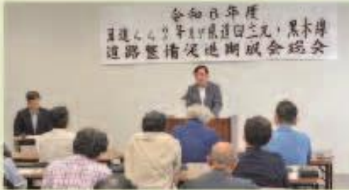
5月28日 国道442号・県道田主丸黒木線 期成会総会 (市黒木支所)