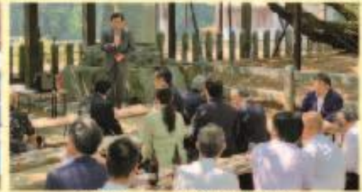
9月7日 アユ祭 (紫雲鳴神社)