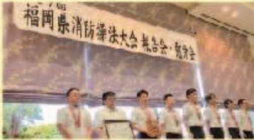
9月1日 県消防操法大会報告会 表彰チーム