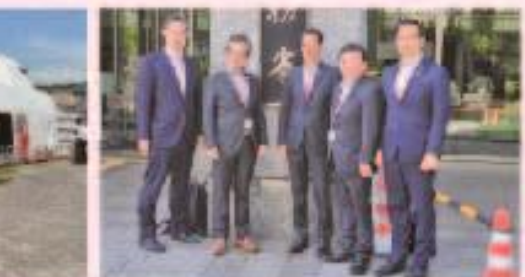
9月20日 選抜地域活性化議員連盟 要望活動 (税務省)